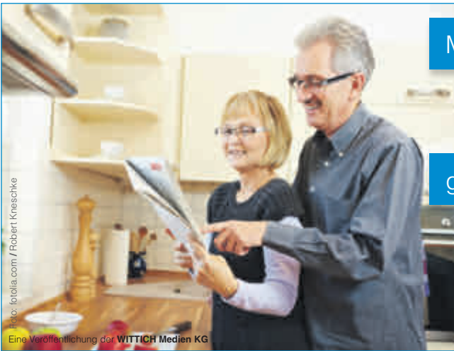
Eine Veröffentlichung der WITTICH Medien KG