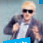
Deutsche Schlagermacht mit Heino

Feiern, tanzen & singen Sie mit Ihren Lieblingskünstlern!