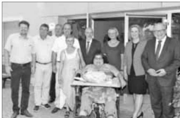
Bei einem Rundgang in Polsingen machte sich die bayerische Sozialministerin Kerstin Schreyer (2. v. rechts) gemeinsam mit Vertretern der Diakonie Neuendettelsau, der Bewohner und ihrer Angehörigen sowie weiteren Kommunal- und Landespolitikern ein Bild von der Arbeit für Menschen mit Behinderung.

Kerstin Schreyer, selbst gelernte Sozialpädagogin mit einschlägiger Berufserfahrung, versicherte, sie habe „finanzintensive Vorlagen“ für ein Kabinettsreffen zum Thema Menschen mit Behinderung in der kommenden Woche entwickelt.